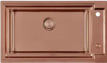
OUTLINE COPPER 6602 008